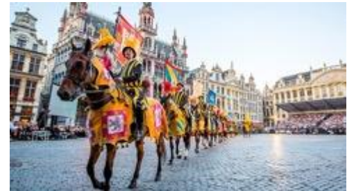
Itinerario di Carlo V