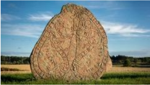
Rotta dei Vichinghi