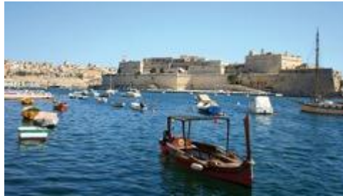
Rotta dei Fenici