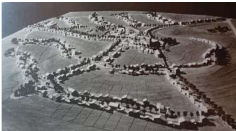
Plastico del villaggio La Martella tratto dal libro: Matera e Adriano Olivetti di Federico Bilò ed Ettore Vadini